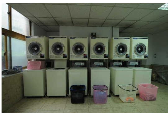
大莊館自助投幣洗衣機、烘衣機