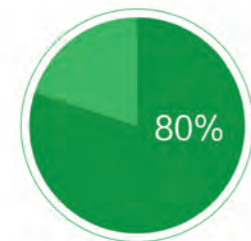
80% 毕业于985、211全国重点院校

学而思培优高质量的师资水平源自严格的教师选拔，从初试到签约，从复试培训到岗前培训，每一位老师都经过层层筛选，最终录取率低于5%。严格的考核标准，只为选择优中之优，选择最好的老师，给学员最好的教育。